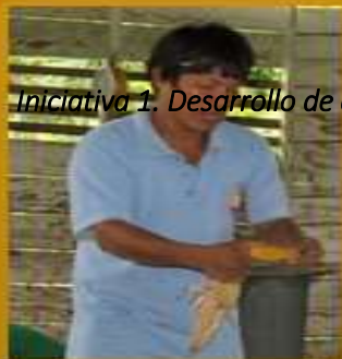
Iniciativa 1. Desarrollo de capacitaciones en derecho étnico, participación y consulta previa